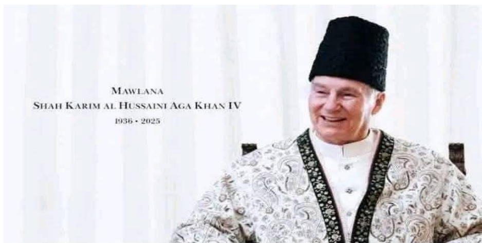
Mawlana SHAH KARIM AL-HUSSAINI AGA KHAN IV 1936 • 2025

إِنَّا لِلَّهِ وَإِنَّا إِلَيْهِ رَاجِعُونَ