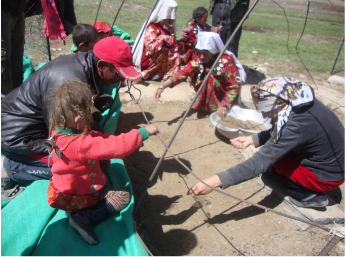
گرین هوس و گدام کاه در پامیر خورد به نجاری داکتر اصلیشاه در پامیر خورد