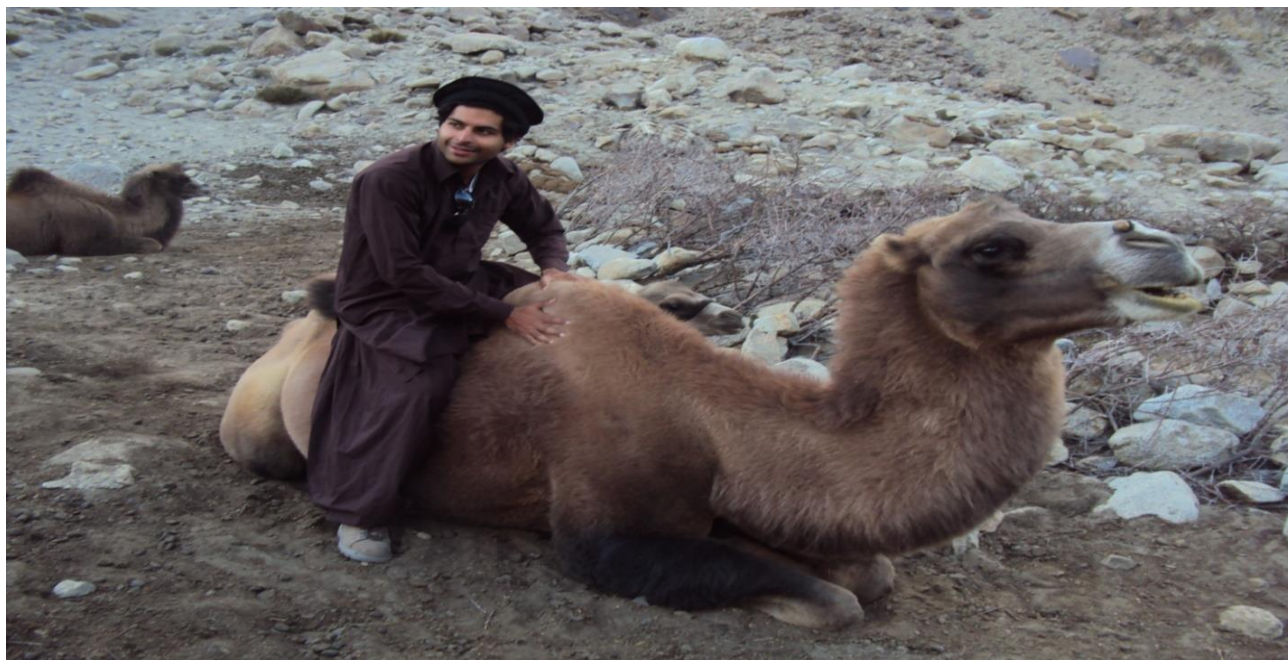
محترم انكور سوار بر اشتر در بروغیل و اخان ۲۰۱۴