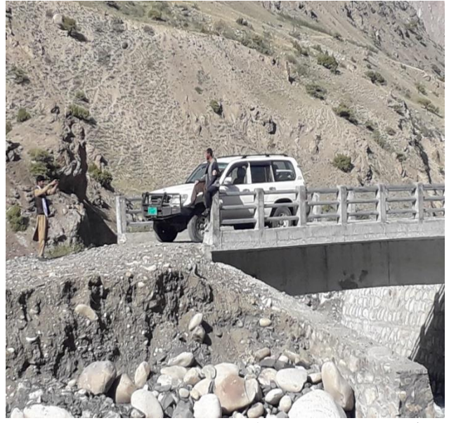
سرک موتر رور در پامير