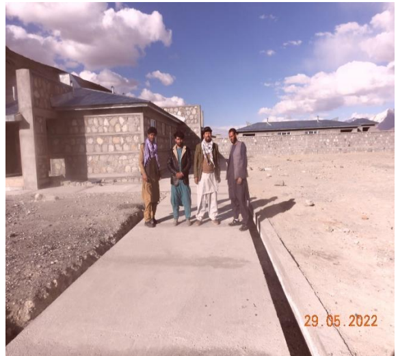
ساحه کلينیک در پامير خورد که توسط دفتر بنياد آقاخان بنا یافته است