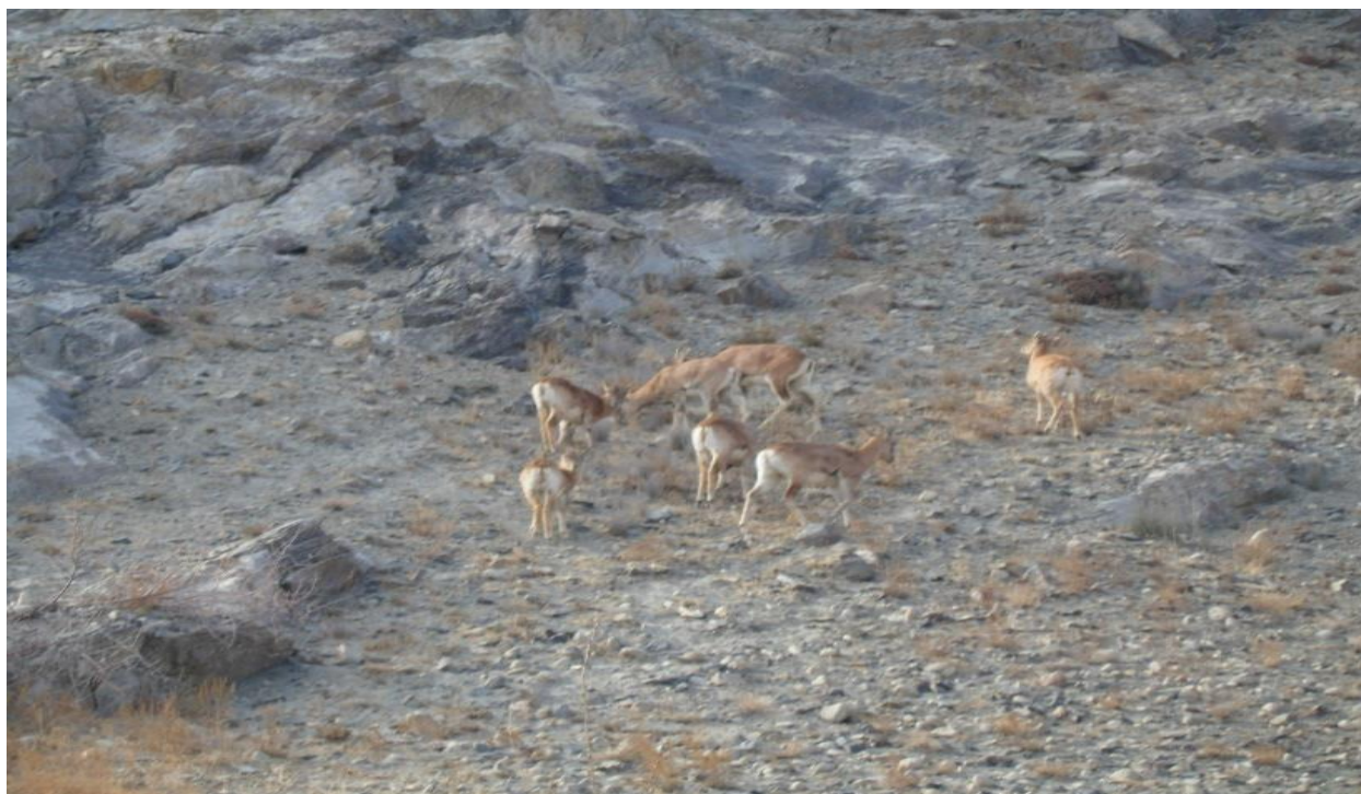
آبییکس یا بز کوهی در قسمت زمینهای زراعتی اورگند پایان گرفته شده در برج نومبر ۲۰۱۵