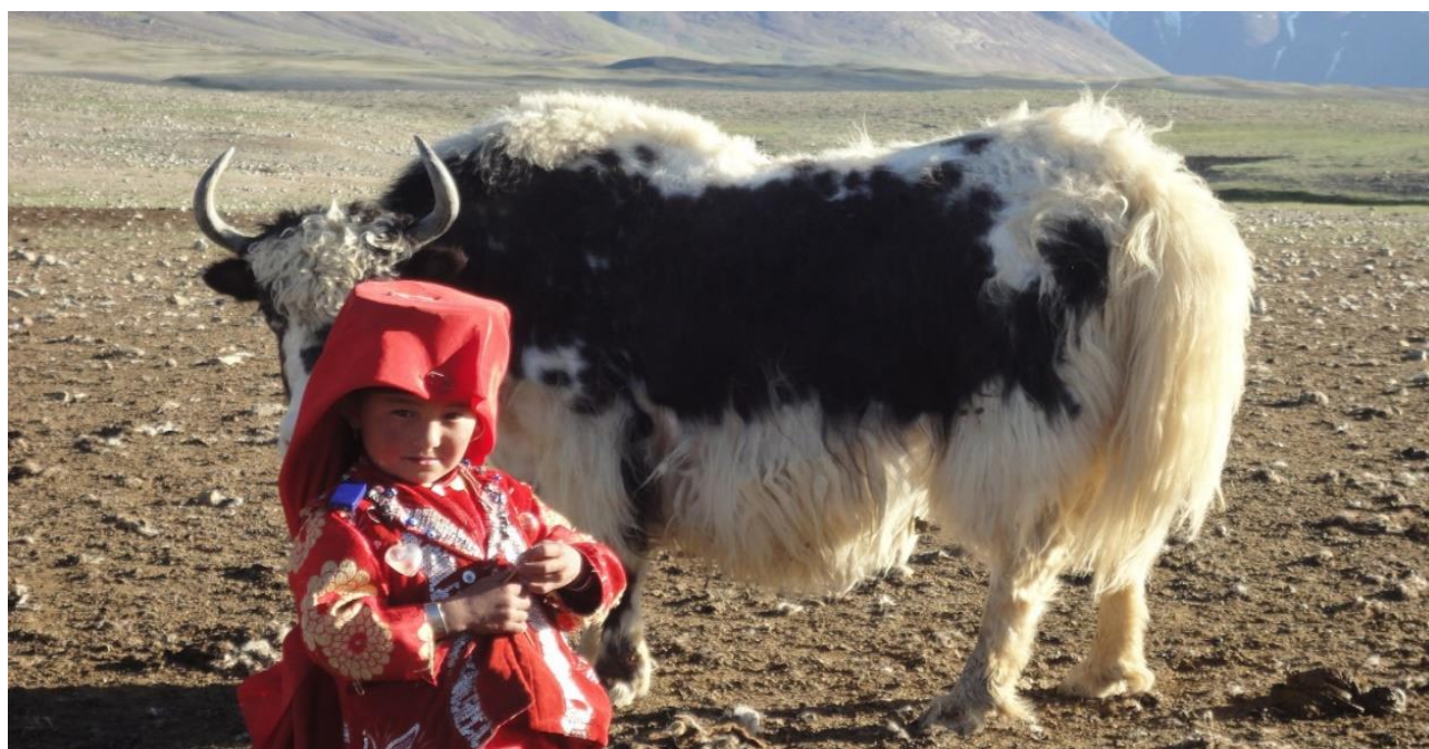
دخترک زیبای قرغز در پامیر خورد در چراه گاه با غزگاو