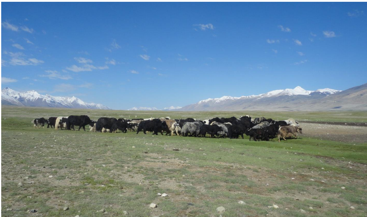
گله غزگاو در شورای یرغایل پامیر خورد