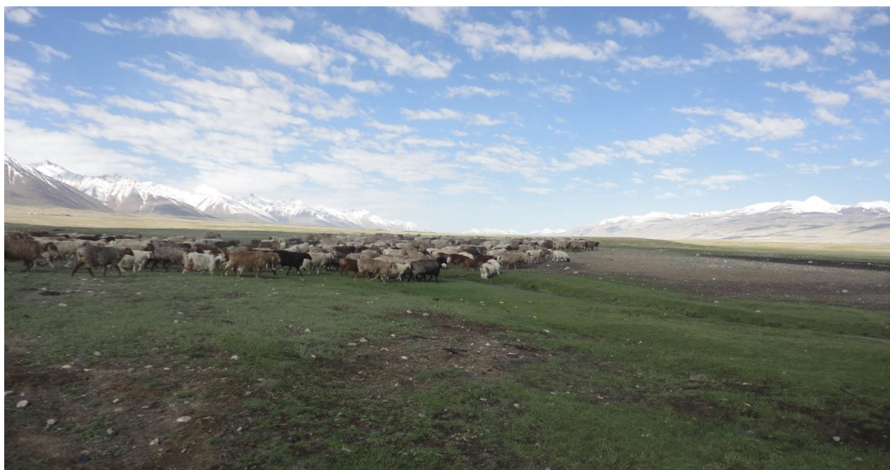
رمة گوسفندان در یرغایل پامیر خورد