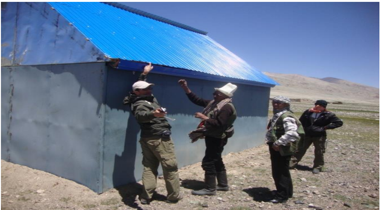
شورای یرغایل در پامیر خورد