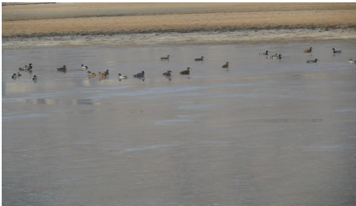
مرغابیها در نومبر سال ۲۰۱۵ در قریه ایشمرغ واخان