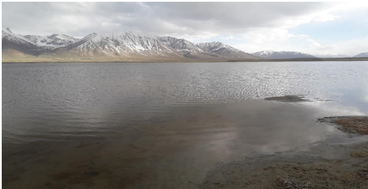
طبیعت زیبای پامیر

نوت: این معلومات از سالهای ۲۰۱۵ ؛ ۲۰۱۷ و ۲۰۲۲ گرد آوری شده است که شاید در ارقام حیوانات اهلی و وحشی تفاوت رویکار گردیده است ؛ باید یادآوری نمود که قبلاً کلینیک صحتی در پامیر وجود نداشت ولی در سال ۲۰۲۲ و ۲۰۲۳ کاملاً کار آن تکمیل و مورد بهره برداری قرار گرفت که در حال حاضر داکتر صاحبان در پامیر خورد خدمات صحتی را برای مردم محروم در پامیر خورد انجام میدهند.